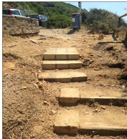
In corso d'opera